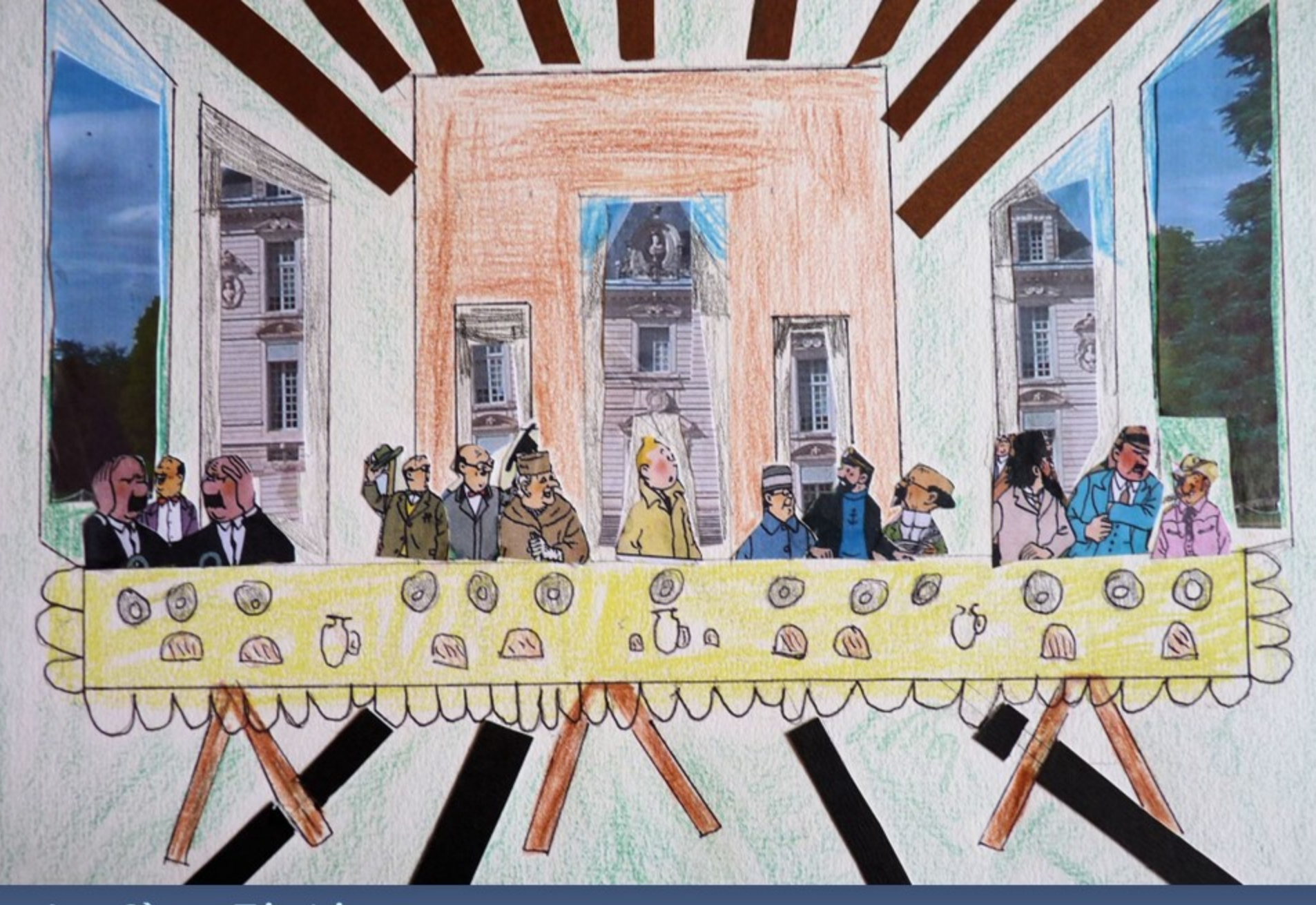
La Cène Tintin (par un collégien de Cosne-sur-Loire)