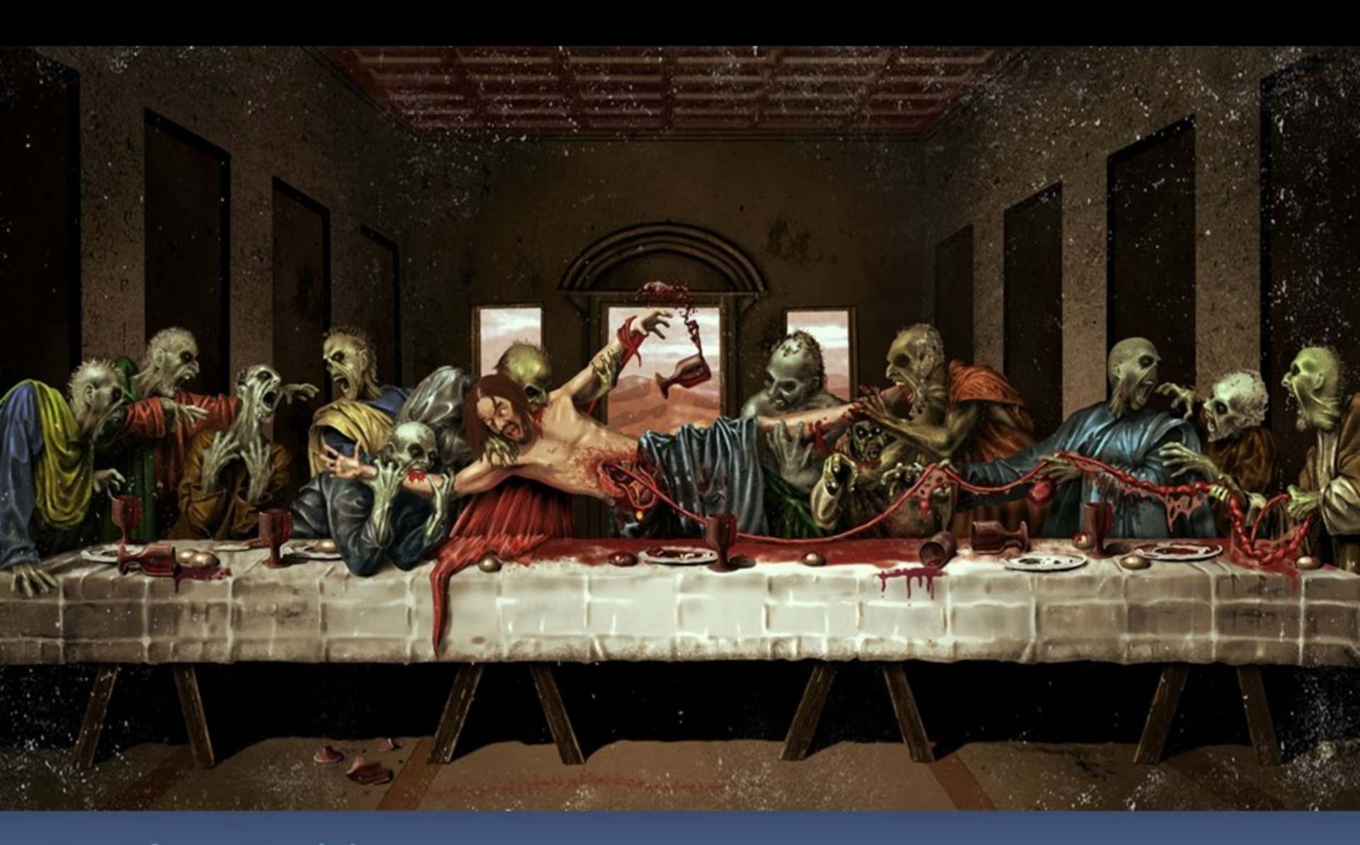
La Cène Zombie