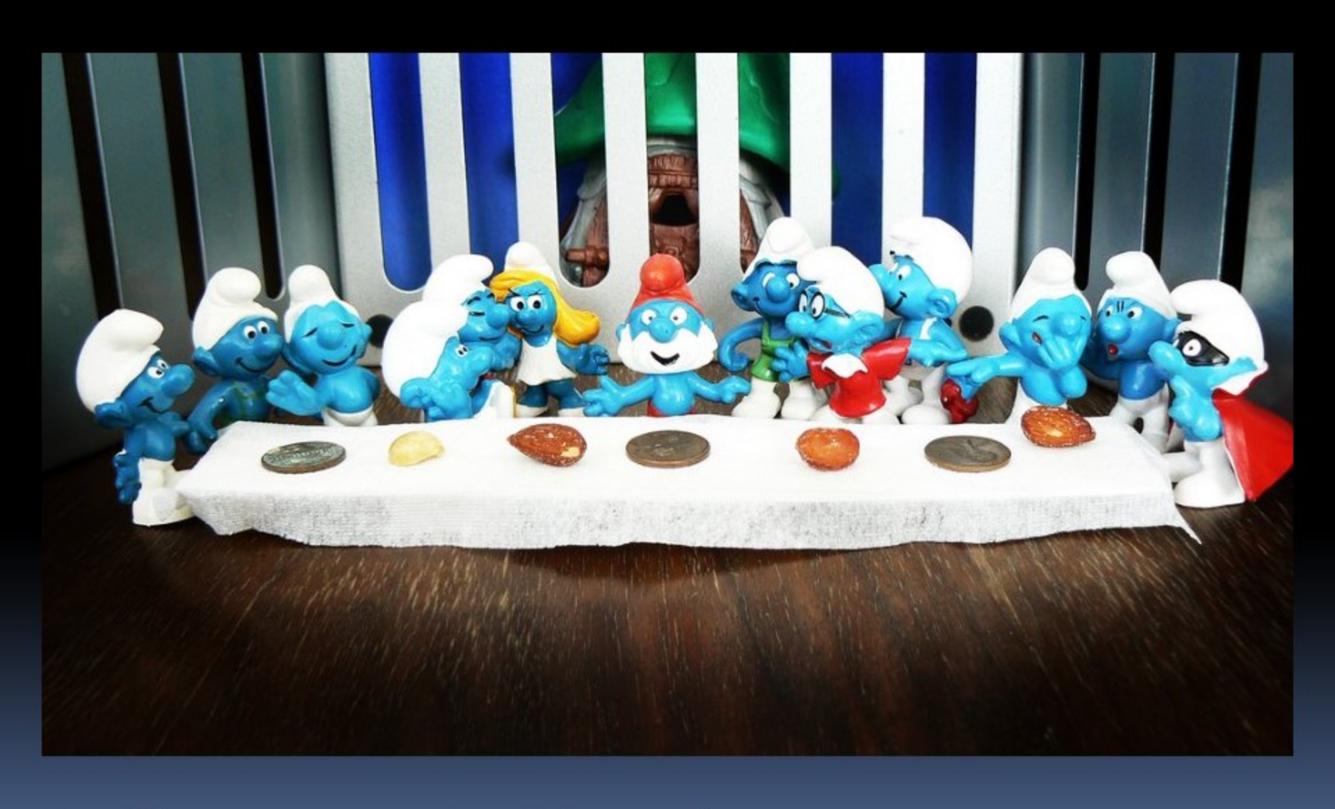
La Cène au pays des Schtroumfs