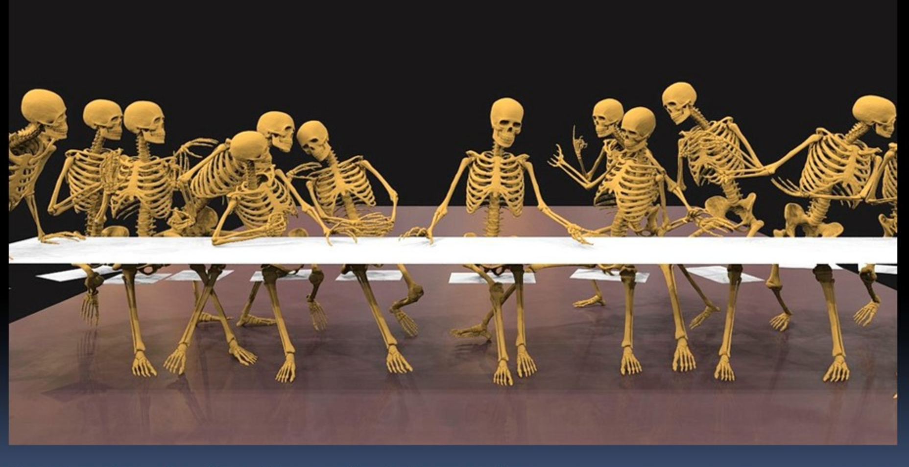
Anatomie de la Cène de Léonard (reconstitution numérique permettant d'explorer chaque personnage de la fresque du point de vue anatomique)