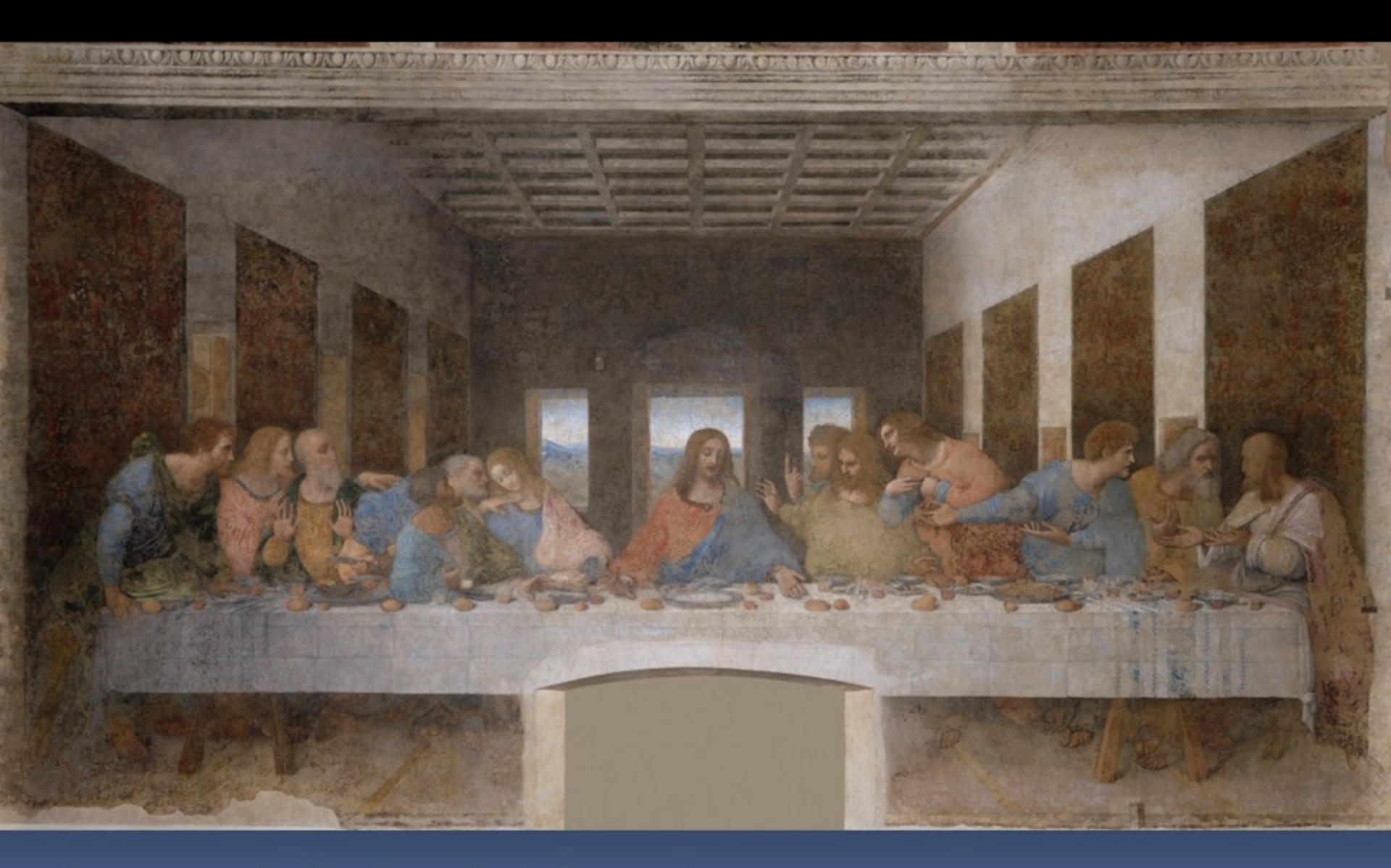
Œuvre originale de Léonard